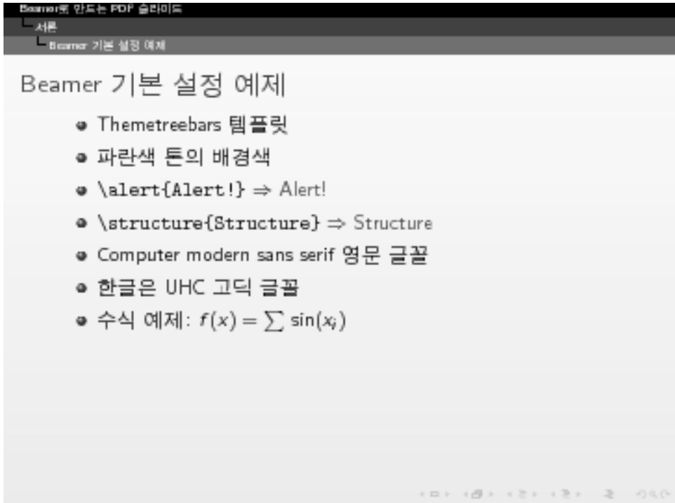
그림 6.2: Beamer 슬라이드 예제.

그림 6.2은 여기에서 설명한 주요 옵션들을 사용하며 만든 슬라이드를 나타낸 것이다. 제목, section, 그리고 subsection 정보가 상단의 네비게이션 바에 나타나고, 오른쪽 하단에는 네비게이션 심벌들이 표시되어 있다. 수학 글꼴을 자세히 살펴보자. \sum 의 경우 해당 산스세리프 글꼴이 없으므로 computer modern symbol에서 빌려온다. \alert 와 \structure 는 다음 절에 설명되어 있다.